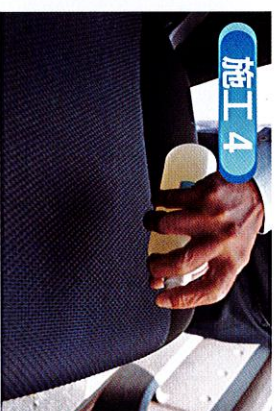
■アレルリムーバーAをスプレーしてダニの糞などを擬集し吸着効果を最大限に高めます。