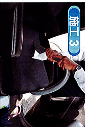
■専用機材を使い、こびりついているダニの「糞」など、ダニアレルゲンをシートの奥から離し、吸い上げます。

日本カークリーニング協会の認定を受けた「ダニ駆除消毒業者」が丁寧に施工いたします。